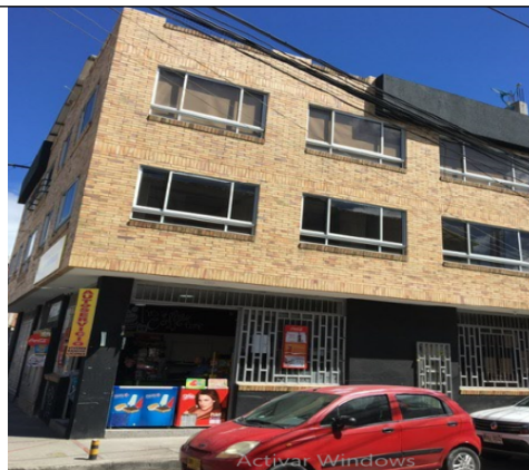
Fotografía 3. Fachada – lateral del predio