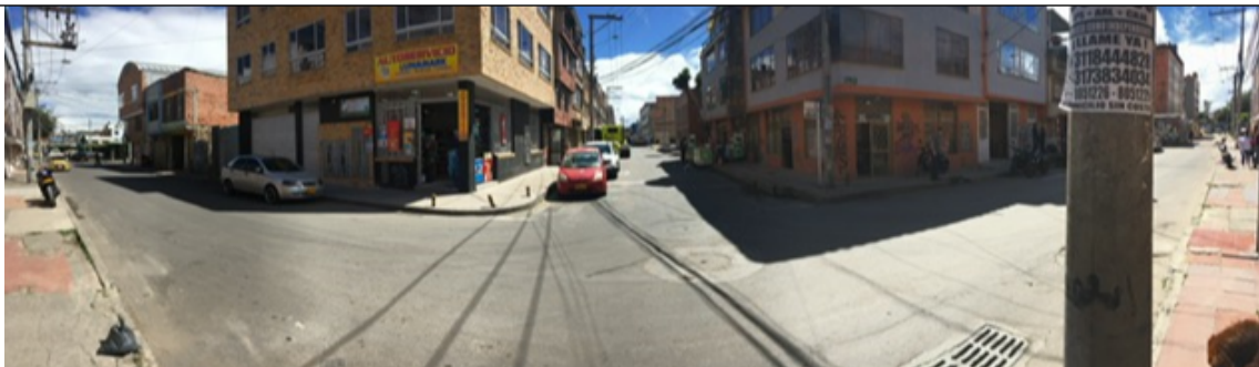
Fotografía 1. Vista general del predio – unidad residencial-comercial