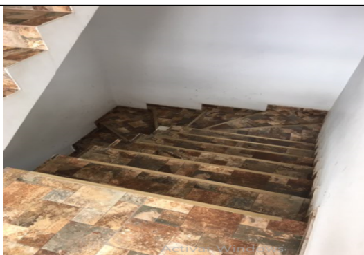
Fotografía 6. Escaleras – acceso apartamentos.