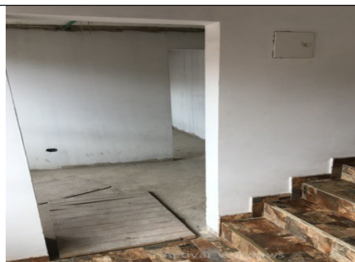
Fotografía 7. Acceso apartamentos en obra.