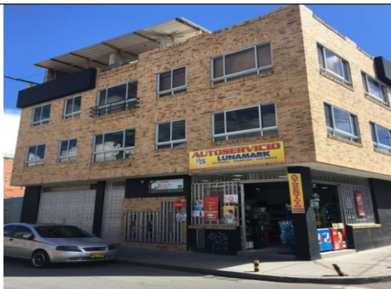
Fotografía 2. Fachada – principal acceso al predio