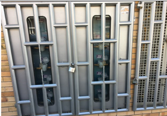
Fotografía 4. Medidores de cada unidad residencial